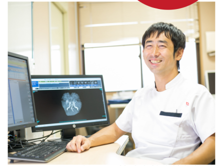
ニューロテックメディカル株式会社取締役社長 脳梗塞・脊髄損傷クリニック院長 日本脳卒中学会認定脳卒中専門医 日本リハビリテーション医学会認定専門医 日本リハビリテーション医学会認定指導医